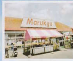
食品スーパー[丸久]

一人暮らしがむずかしい方へ、お住まいをご提案いたします。 安心と思いやりの元気の出るマンション