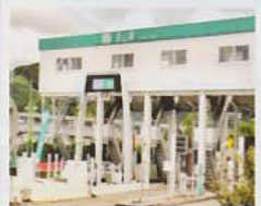
山陽道[徳山東インター]