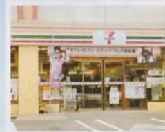
コンビニエンスストア