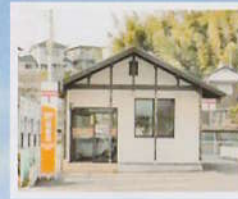
郵便局 [久米簡易郵便局]