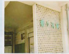
J R山陽本線[櫛ヶ浜駅]